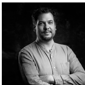
Figure de proue de la vie musicale néerlandaise, Antony Hermus est le chef permanent de l'Orchestre National de Belgique. Régulièrement invité à l'Opéra Orchestre Normandie Rouen, il s'est rapidement imposé dans les sphères opératiques et symphoniques en dirigeant des ensembles de renom comme le Royal Philharmonic, le BBC Scottish, l'Orchestre National de Lyon...