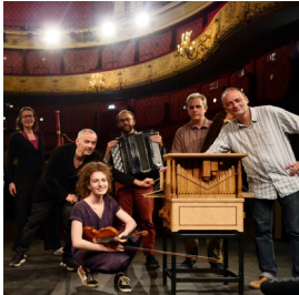
Les Lunaisiens